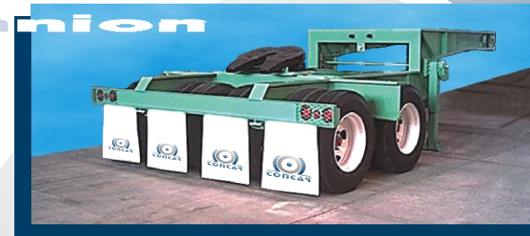
Jeep Dolly Suspensión Trunnion 65 toneladas