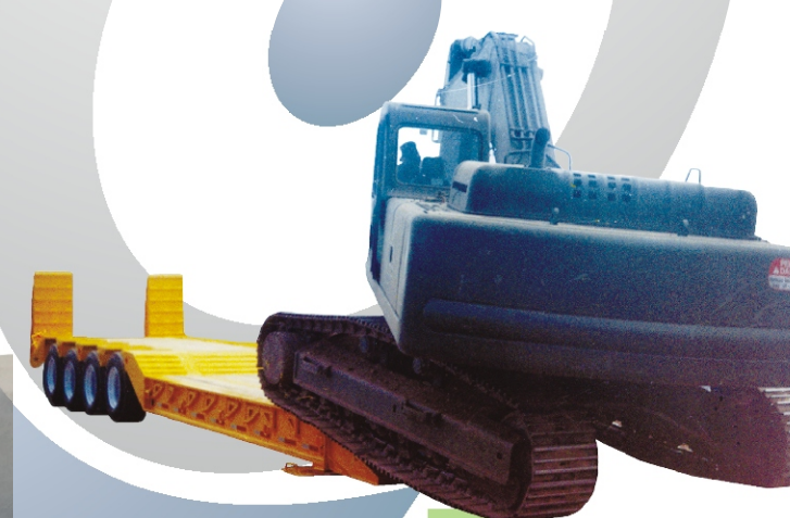
Cama baja 100 toneladas cuello desmontable