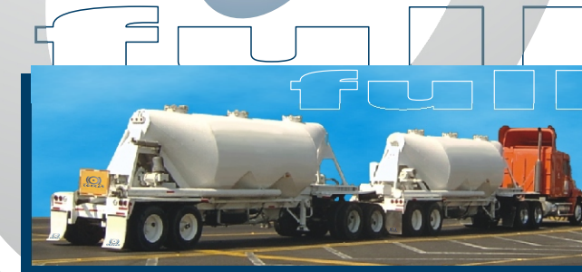
Tolva en combinación FULL