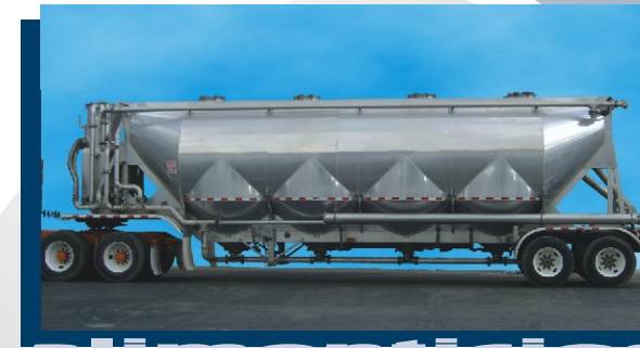
Tolva de acero inoxidable para productos alimenticios